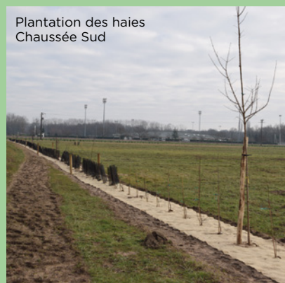
Plantation des haies Chaussée Sud

Ces aménagements se sont poursuivis sur le terrain situé rue Jean Brémard. Des noues et un aménagement paysager avec implantation d'arbres et d'arbustes viennent compléter l'amélioration de l'entrée de ville et les travaux de voirie du quartier de la Caillerie menés en 2020. Notons également que la nouvelle configuration de ce terrain servira aux manifestations et notamment le Festival Avoine Zone Groove. ●